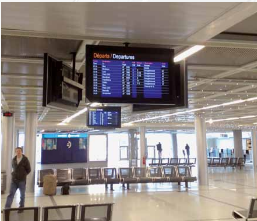
Aeroporto di Nantes / Francia