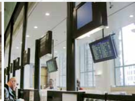
Stazione di Anversa / Belgio