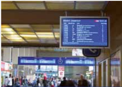
Stazione di Vienna / Austria