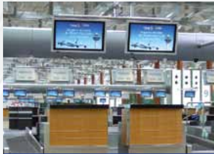
Aeroporto di Changi / Singapore