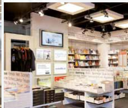
Libreria Hollmann, Duesseldorf / Germania