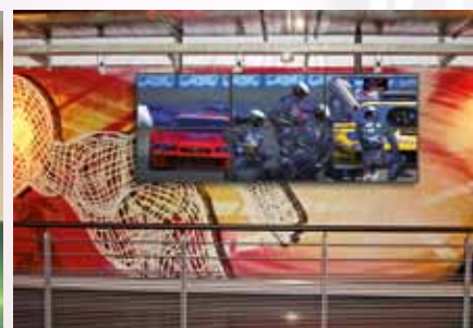
Cluster di sei monitor