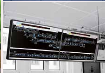
Cluster orizzontale di due monitor