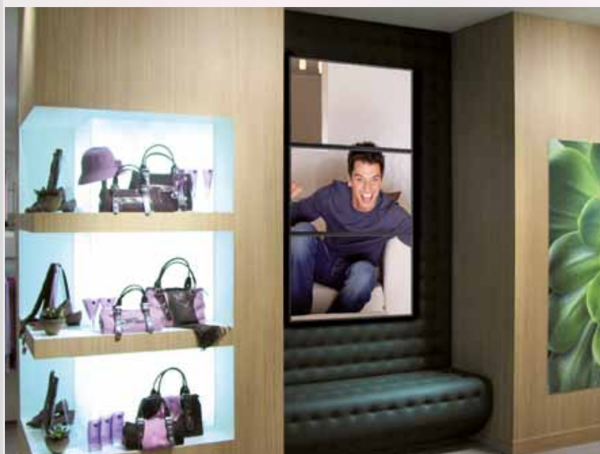
Cluster verticale di tre monitor