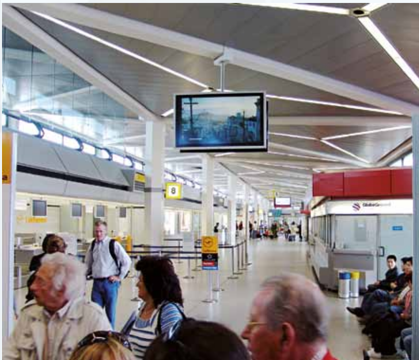
Aeroporto di Tegel, Berlin / Germania