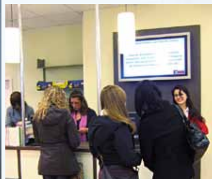
Libreria Huebscher, Kulmbach / Germania