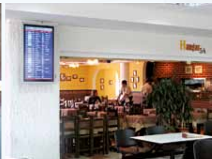
Aeroporto di Bogota / Colombia