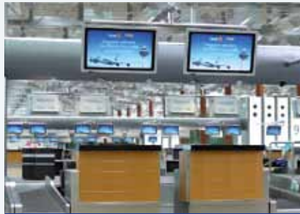
Aeroporto di Changi - Singapore